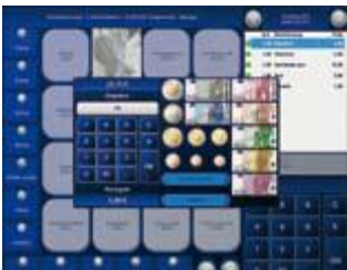
Barrechnung / Wechselgeld